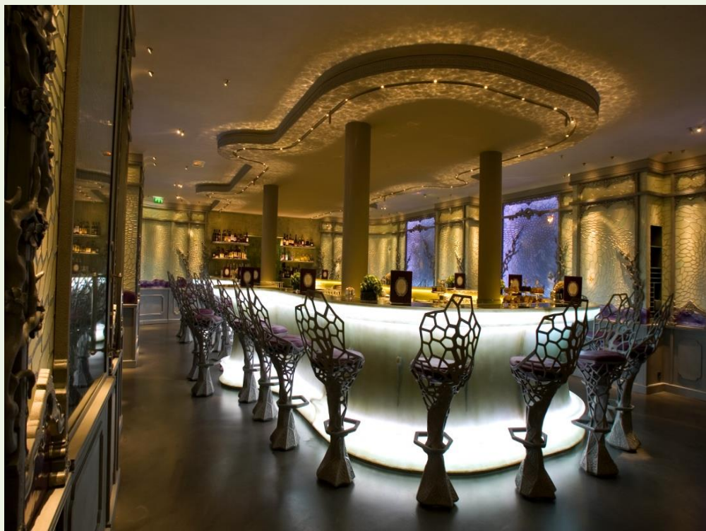
Décor Roxane Rodriguez

Ladurée Le Bar dévoile son savoir-faire au travers d'un bar malicieux qui brouille les pistes du style Maison en affirmant ainsi une nouvelle personnalité sans trahir l'esprit Ladurée.